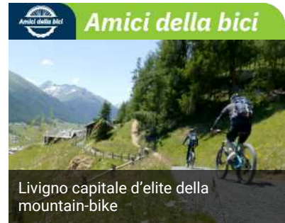
Livigno capitale d'elite della mountain-bike

Si tratta della prima edizione a cielo aperto del concorso "L'Arte Racconta i